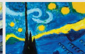
Пример работы команды